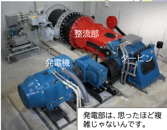
発電部は、思ったほど複雑じゃないんです。

排水口周辺。水量は最大で毎分1m 3 。家庭の普通サイズのお風呂が1分で5つ満水にできるぐらい。