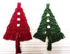
赤ツリー★緑ツリー