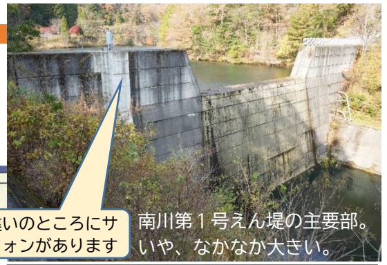
南川第1号えん堤の主要部。色違いのところにサイフォンがあります

湖側のサイフォン部。…理屈ではわかっているのですが、機械の力なしで元の水面より高い位置まで水が上がるのを見ると、不思議な気分です。