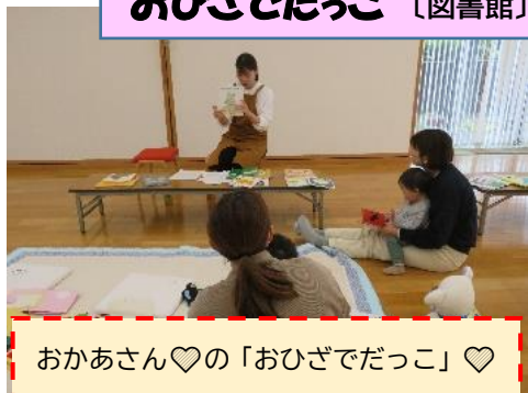
おかあさん♡の「おひざでだっこ」♡